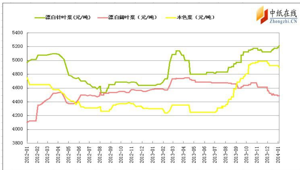
图 4: 国内市场纸浆价格最新走势

本周针、阔叶浆市场表现分明，针叶浆市场活跃度较高，商家心态也较为乐观，而阔叶浆市场持续低迷疲软，行情稳中偏弱，市场需求有待提振；本色浆和化机浆市场基本稳定。