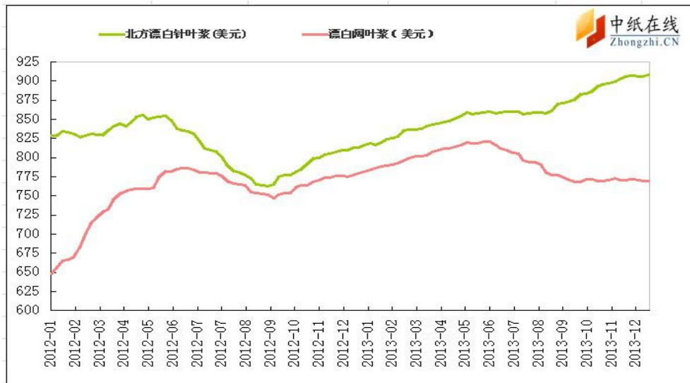
图 3: 纸浆 FOEX 走势监测图