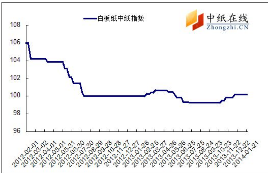
图 3：白板纸中纸指数走势图

2014 年 1 月 24 日白板纸价格指数为 100.16，与上周持平，较周期内最高点 106.02 (2012- 2-1) 下降了 5.86。