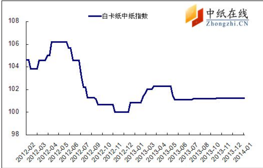
图 1：白卡纸中纸指数走势图

2014年1月24日白卡纸价格指数为101.22，与上周持平，较周期内最高点106.02（2012-5-2）下降了4.98。